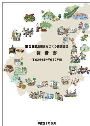
第2期高島市まちづくり推進会議の報告書

第2期は、市民委員の関心にに応じて5つのグループに分かれ、地域での子育て、若者の働