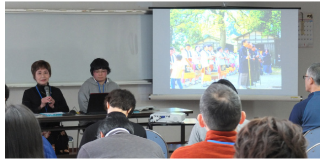
第2期高島市まちづくり推進会議「第8回（最終回）全体会議」での成果報告の様子（2019年3月23日）

き方、小さな農業、地域で学び育つ場、神社とお祭りについて問題を設定した後、その種類に応じて、アンケート調査、インタビュー調査、参与観察を実施しました。調べたいことをなかなか言葉で表現できなかったグループ、早くからアンケート票の設計に取りかかれたグループなど、グループごとに展開は異なりましたが、全てのグループが報告書の形にとりまとめることができましたし、成果報告のための全体会議では、市長をはじめとする参加者を前に無事発表することができました。